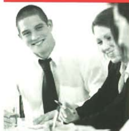
Becas de formación especializada: Salud, Prevención, Medio Ambiente y Seguros 2011