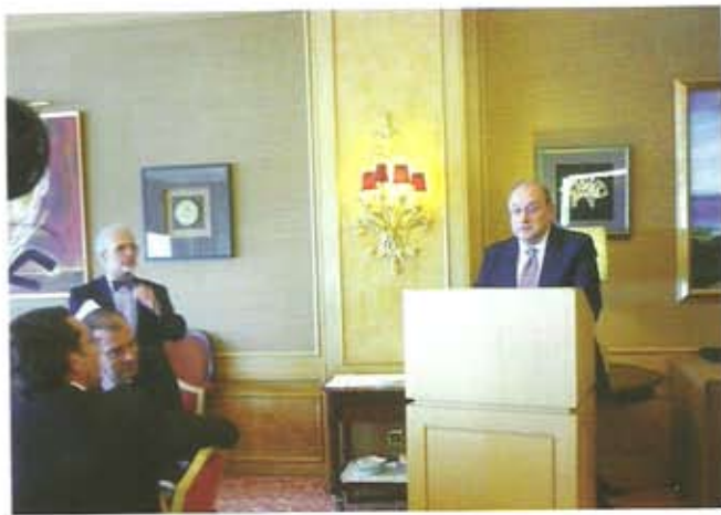
El Embajador cierra el acto